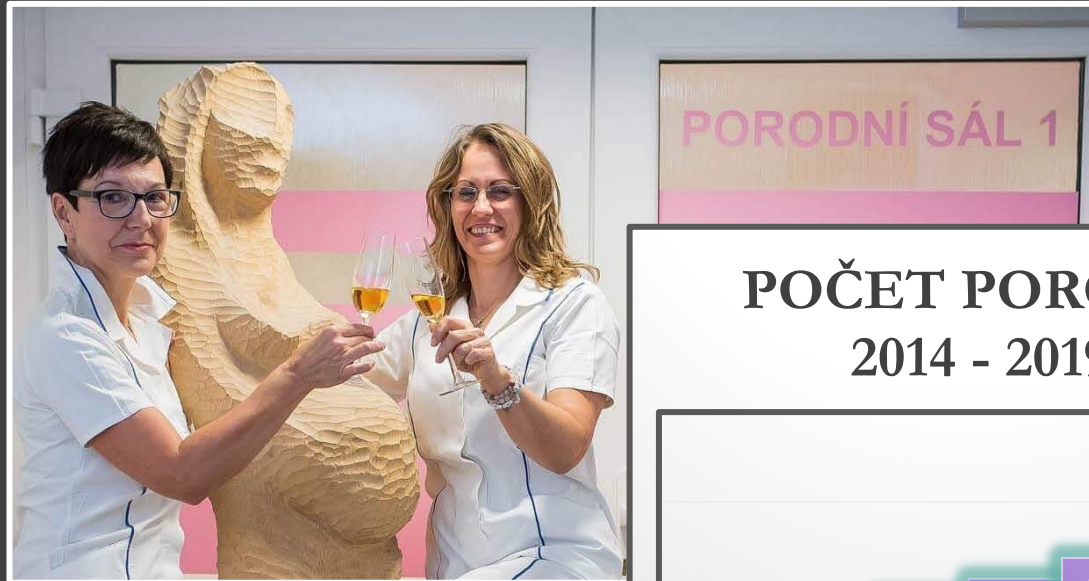
POČET PORODŮ 2014 - 2019